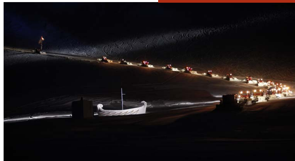
Die verwendeten Fotos stammen aus der Produktion Hannibal 2008