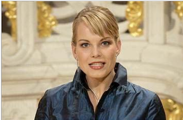
Ein Mezzosopran aus dem kalten Norden: die Lettin Elina Garanca