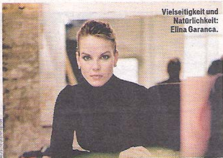
Vielseitigkeit und Natürlichkeit: Elina Garanca.