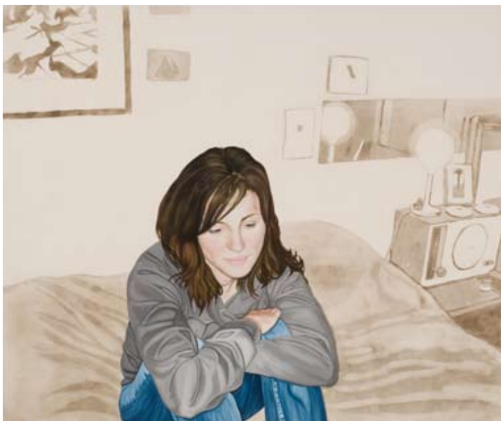
„Alana and her Dust“, 2008 60" x 72" (152 x 183 cm) oils, dust, glue and acrylic sealer on canvas

„In Physik lernt man, dass Materie vor allem aus leerem Raum besteht. Alles ist zumeist Nichts“ resümiert die Künstlerin und meint weiter: „Ich habe nach einem Modell dafür gesucht, und nach einem Material, das mit Vergänglichkeit und Fragilität assoziiert wird.“ Die realistisch gemalten Figuren werden so zu manifesten Subjekten in einer zerbrechlichen, verschwindenden Welt. Den Gesetzen der Physik zufolge zerfallen menschliche Wesen und die umgebende Welt laufend, so wie sie sich auch andauernd regenerieren. Doch auf der Suche nach der ganzen Wahrheit bleibt die Wissenschaft vor allem ein intellektueller Kommentar zur natürlichen Welt. Viel eher ist die Kunst in der Lage, tiefere emotionale Bereiche zu berühren. Wird die Realität von uns geschaffen oder erschafft die Realität uns? – Fragen, die von den Bildern Allison Cortsons berührt werden. Diese Bilder konfrontieren uns nicht zuletzt mit unserer unausweichlichen Vergänglichkeit und bieten gleichzeitig die Möglichkeit zur Akzeptanz dessen, indem sie die ganz normalen, flüchtigen Momente in ein verführerisches und klares Licht tauchen, das eine Poesie ermöglicht, aus dem sich neue Bedeutung entfaltet.