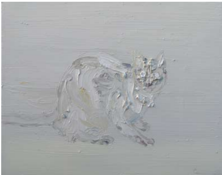
“White Gin #2”, 2008 21” x 28” (53 x 71 cm) oil on canvas

Die Sujets ihrer Bilder sind einerseits so überschaubar wie andererseits episch breit: Die Niagarafälle, Vulkane, Wüstenlandschaften, aber auch Tiere, Blumen und Stilleben und die irritierend verloren wirkenden Hobo Clowns aus der jüngsten Schaffensperiode. Schon immer tauchen historische Vorbilder und große Erzählungen wie zum Beispiel von Seeschlachten auf, wobei sie nicht selten ikonografische Zwitter – die große dramatische Erzählung, vermischt mit Kindheitserinnerungen – produziert. Shakespeare-ähnliche Dramen werden in femininen Farben erzählt und verwischen die Grenzen zwischen Gewalt und Schönheit. Neben den eindeutig narrativen und figurativen Aspekten überzeugt aber vor allem der Umgang mit Farbe als unmittelbar gestaltendem Material. So verwundert es auch nicht, dass die Künstlerin als Ausflüge in andere Substanzen immer wieder an Keramiken arbeitet, einer Technik, mit der sie wundervoll märchenhafte oder surreale Geschöpfe kreiert. Ihre Ausbildung in „Experimental Animation“ an der School of Film des Californian Institute of the Arts in Valencia (California) wird unmittelbar sichtbar, wenn Schulnik ihre gemalten Hobo Clowns aus Plastilin formt und zu traurigen Helden kurzer Animationsfilme werden lässt.