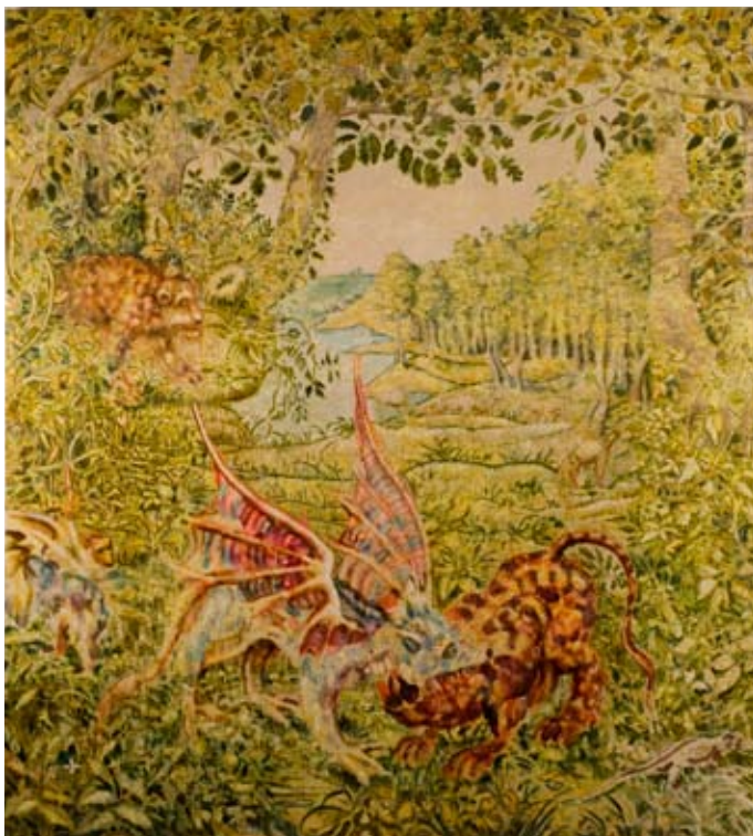
“Green Forest (After After)”, 2007 90" x 82" (229 x 208 cm) oil, acrylic, ink, paper on canvas

Einen Schritt weiter in der Frage nach Fragment und Einheit, nach malerischen Prozessen und rezipierender Interpretation geht Deany in seiner großen Skulptur Seated Talisman , die nach der Wesensart von Mythen, nach alten Ritualen, nach der Qualität und Funktion des Primitiven und des Zivilisierten fragt. Inspiriert von den uralten Steinfiguren auf der Osterinsel, über die David Deany in ihren vielen historischen, anthropologischen und soziopsychologischen Aspekten nachgedacht hat, schafft er ein Objekt, das eine emotionale und intellektuelle Atmosphäre evoziert, mit der der Künstler Ahnungen uralter Zeremonien, prähistorischer Geheimnisse und einer „primitiven“ Erzählkunst heraufbeschwört, die bis heute Gültigkeit haben.